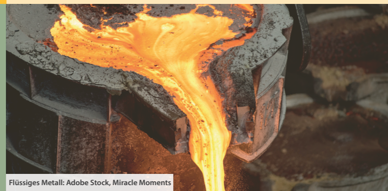
Flüssiges Metall: Adobe Stock, Miracle Moments

Parkmöglichkeiten findest du am Marktplatz (zeitlich begrenzt) und am Bahnhof in Eisenberg (kostenlos und zeitlich unbegrenzt). Die Anreise ist alternativ auch mit der Bahn zum Wanderbahnhof in Eisenberg möglich. Von dort einfach der Beschilderung in die Stadtmitte folgen. Dort findest du auch Einkaufs- und Einkehrmöglichkeiten zur Stärkung.