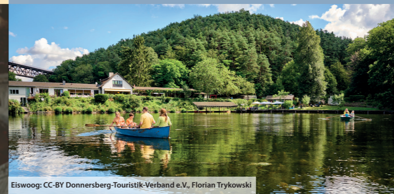
Eiswoog: CC-BY Donnersberg-Touristik-Verband e.V., Florian Trykowski

Parken kannst du direkt am Eiswoog an der L395. Alternativ ist die Anreise mit der Bahn bis zur Haltestelle „Eiswoog“ möglich oder Sonn- und Feiertags (von Mai bis Oktober) mit der Stumpfwaldbahn von Ramsen zum Eiswoog. Die Schmalspurbahn eignet sich ideal, um die Etappe abzukürzen.